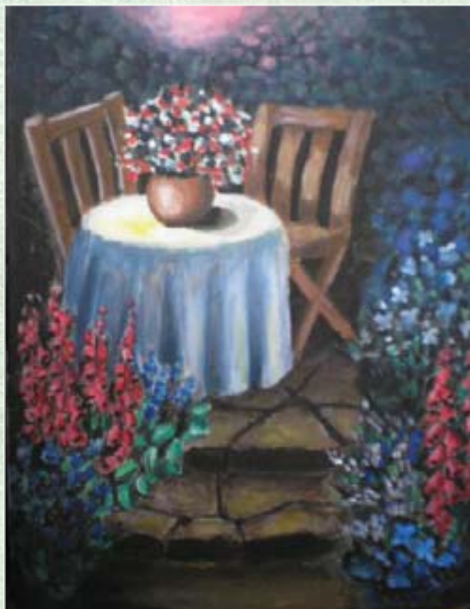
Pavčina Šrnová • 4P

Po chvíli se vzpamatovaly a šly dál do jedné z chodeb. Byly vystrašené, ale obě věděly, že vrátit se zpět už nemohou. Lilith trochu zmatkovala: „Když se tu ztratíme, tak nás už ale nikdo nenajde.“ „Vždyť už ztracené jsme, tak je jedno, kam teď půjdeme“, odvětila